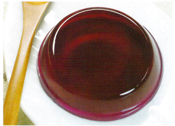
ソフトアガロリー ぶどう

測定機器: クリープメーター RE-3305S (株式会社 山電) 測定条件: 充填容器 直径40mm 高さ15mm、プランジャー20mm、圧縮速度10mm/sec、クリアランス5mm、温度10±2°C及び20±2°C